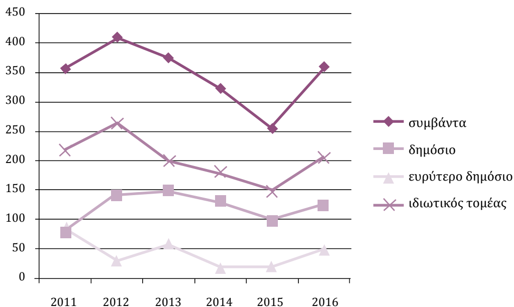
Γράφημα 1: Συμβάντα διαμαρτυρίας 2011-2016