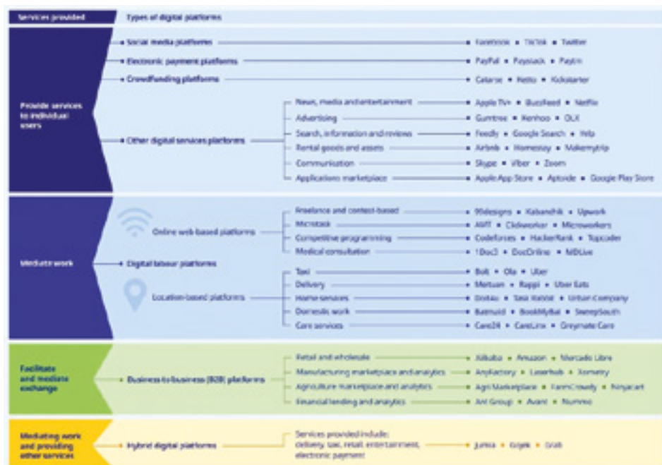
Σχήμα 1: Τύποι ψηφιακών πλατφορμών